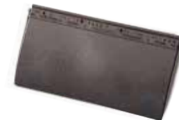
Elfino Grande korte pan 388 x 198 mm