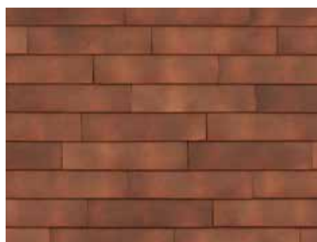
Smokey Red - 956 - in wildverband geplaatst