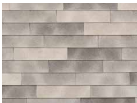
Smokey White-grey - 955 - in wildverband geplaatst