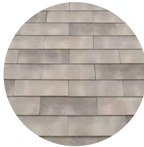
3 tinten witgrijs genuanceerd Smokey White-grey - 955