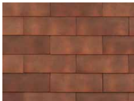
Smokey Red - 956 - kruisgewijs geplaatst