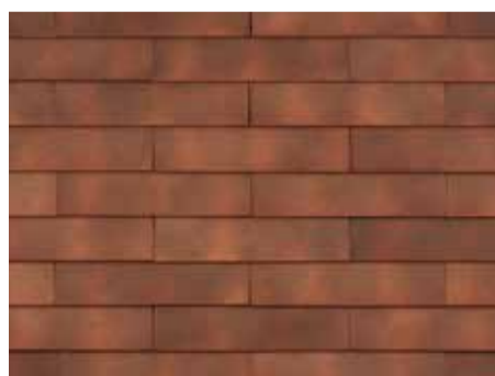
Smokey Red - 956 - kruisgewijs geplaatst