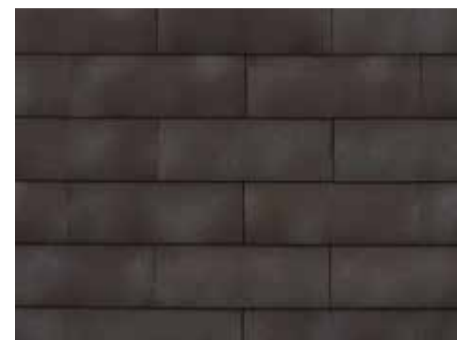
Smokey Brown-grey - 957 - kruisgewijs geplaatst