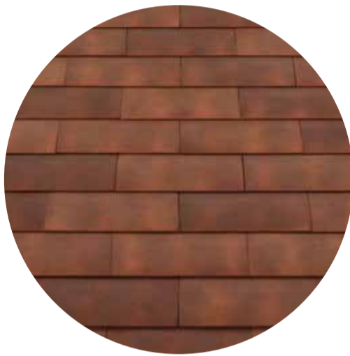
warmrode, roestkleurige nuanceringsen Smokey Red - 956