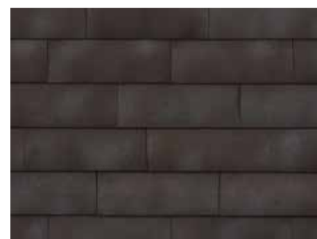
Smokey Brown-grey - 957 - in wildverband geplaatst