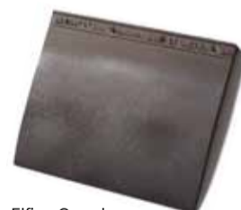
Elfino Grande pan 388 x 320 mm

De Elfino Grande pan is geschikt voor dak én gevel. De Elfino Grande korte pan is enkel bruikbaar voor gevels en benadrukt met haar grote breedte de horizontaliteit van het bouwvolume.