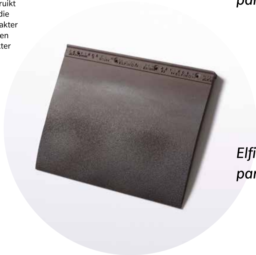
Elfino Grande pan voor dak en gevel