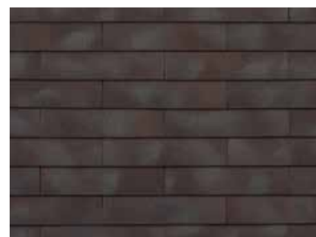
Smokey Brown-grey - 957 - kruisgewijs geplaatst