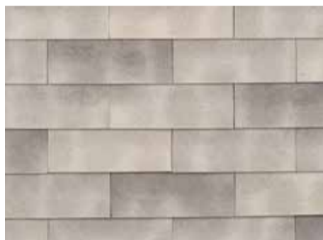
Smokey White-grey - 955 - kruisgewijs geplaatst