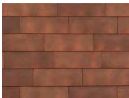
Smokey Red - 956 - in wildverband geplaatst