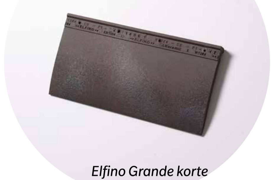
Elfino Grande korte pan voor gevel

Een grandioos mooi dak en een gevel met grandeur vragen om een passende tegelpan. De Elfino Grande collectie bestaat uit 2 pannen: de Elfino Grande pan die kan gebruikt worden op dak en gevel en de Elfino Grande korte pan die enkel op de gevel toegepast kan worden. Het lange karakter en de dunne voetkant van beide pannen resulteren in een fijne uitstraling die elk gebouw een architecturaal karakter geeft, zowel bij gebruik op het dak als op de gevel.