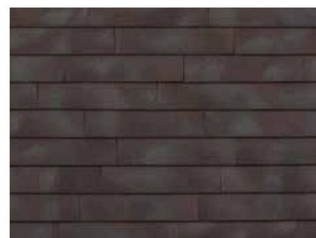
Smokey Brown-grey - 957 - in wildverband geplaatst