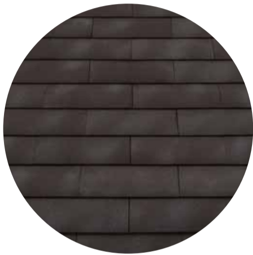
donkerbruin met lichtgemetaliseerde nuances Smokey Brown-grey - 957

Elfino Grande komt er in drie warm genuanceerde tinten: witgrijs, roestrood en donkerbruin, die haar onderscheiden van de reeds bestaande dakpankleuren. Binnen elke kleurvariant zitten er extra nuanceverschillen die het gebouw een veelzijdig en natuurlijk uitzicht geven.