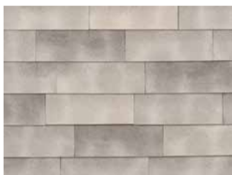
Smokey White-grey - 955 - in wildverband geplaatst